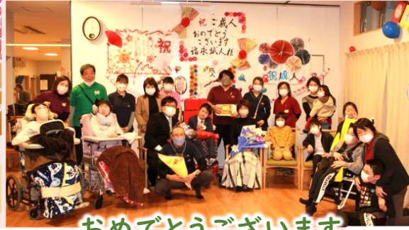
利用し始めた頃のご利用者様

子どもの頃から現在までの写真を、動画にして観ていただきました。これまでの成長を一緒に振り返りながら、感慨深い思いでいっぱいになりました。20歳という大切な節目を、こうして一緒にお祝いすることができ、職員一同大変嬉しく思います。今後もご利用者様が楽しく充実した時間を過ごせるよう、支援していきたいと思っております。